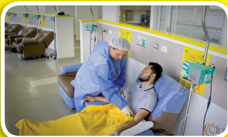
Sala de Quimioterapia